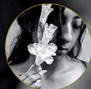
"Respeto a las mujeres y la infancia"

www.fundacionsignosolidarios.com www.misionerasinmaculadaconcepcion.com.es