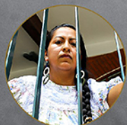
"Por una vida libre de la violencia sexual"